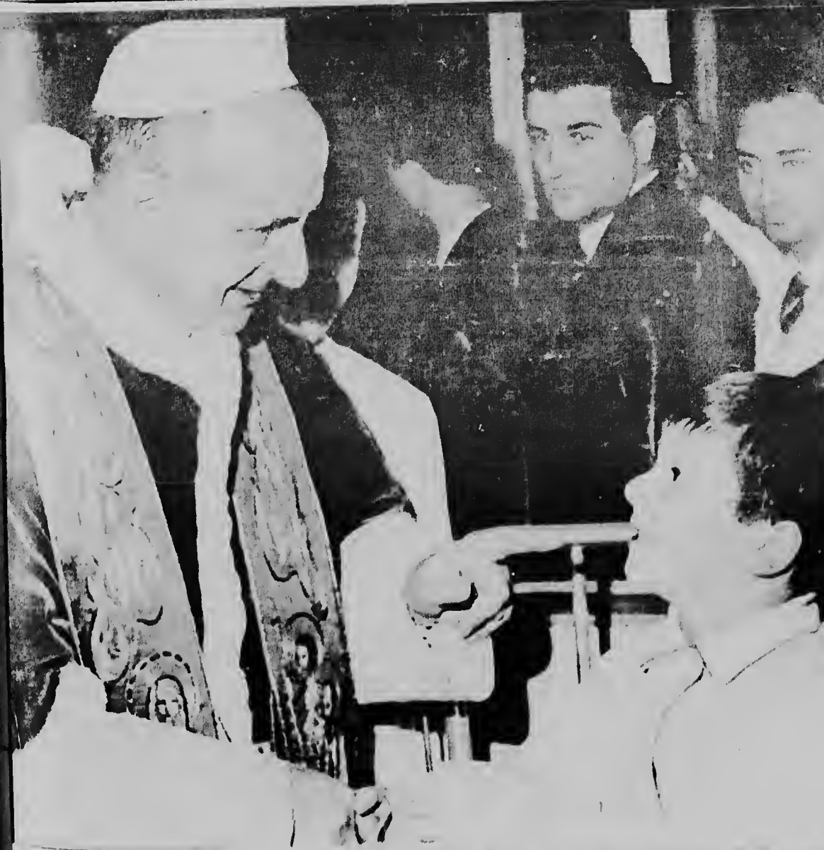
ROMA--Aki Paulo VI ta dunando un mucha riba sala di pediatria na e hospital policlinica di Roma, un pida bolo di Navidad. E Pontifice cu frecuentemente ta ser jamá "friú intelectual", tabata parce hopi emo- cional durante e dia di ayera, riba cual el a reparti bolo y a reza cu algun mucha cu ta condená pa muri pa nan enfermedad.